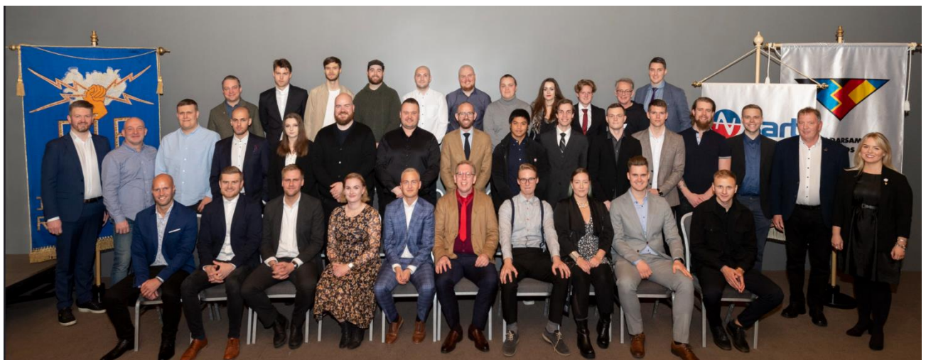
Þessi mynd er frá afhendingu sveinsbréfa 2. október 2021